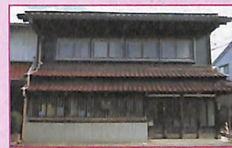
このはま 紙谷漁網店