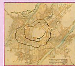
延宝年間 金沢城下図 金沢市立玉川図書館蔵